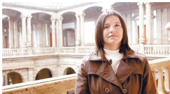
En el proyecto Mex-Culture intervienen científicos del CITEDI de Tijuana y de la Escom, ambas entidades del IPN.

Estudiantes e investigadores del Instituto Politécnico Nacional (IPN) trabajan en el desarrollo de un software que analiza e indexa de manera automática el equivalente a 100 mil horas de documentos audiovisuales (audio, video e imágenes) de la cultura mexicana, pues en el país no hay entidad que lo contenga de forma digital.