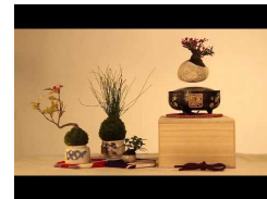
Tu próxima compra absurda: bonsáis que flotan en el aire