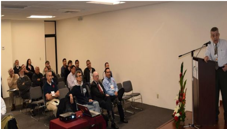
Domingo 06 de Diciembre , 14:44 por Uniradio Informa