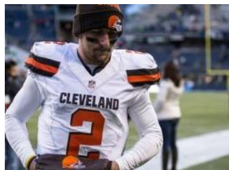
Policía investiga a Manziel por altercado