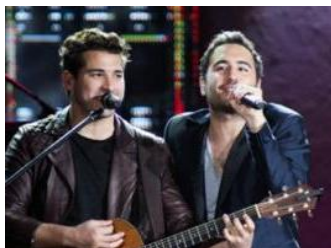
Grupo Reik agradece su cariño a Chile tras exitosa presentación