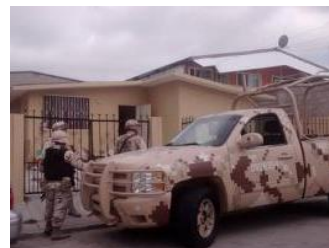
Localizan supuesto narco-túnel en colonia Aeropuerto