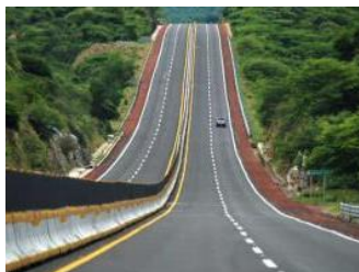
Recomiendan viajar con Mappir este primer fin de semana largo